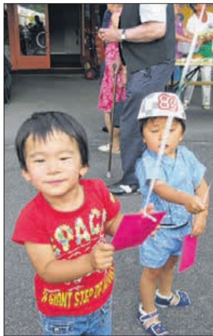
Auch in Bottmingen hockt man am Nationalfeiertag zusammen und feiert den 1. August.