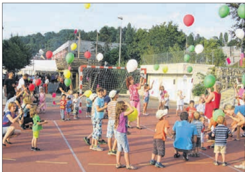
Für die Jüngsten und Kleinsten ist der Ballon-Wettbewerb einer der Höhepunkte des Nationalfeiertages.