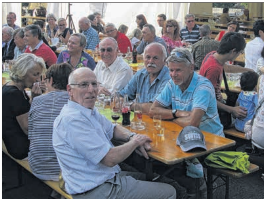
Und hier ein Teil der Prominenz (oder Bottminger Koryphäen), die sich zu Speis, Trank und (politischem?) Austausch trafen.