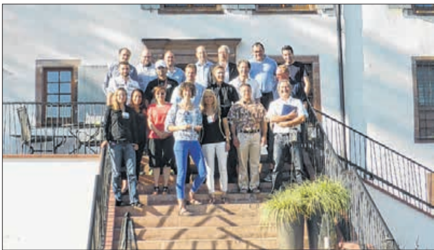
20 stolze Leimentaler Unternehmerinnen und Unternehmer der BNI-Arbeitsgruppe «Landskron» freuen sich vor dem Schloss Binningen über die Auszeichnung