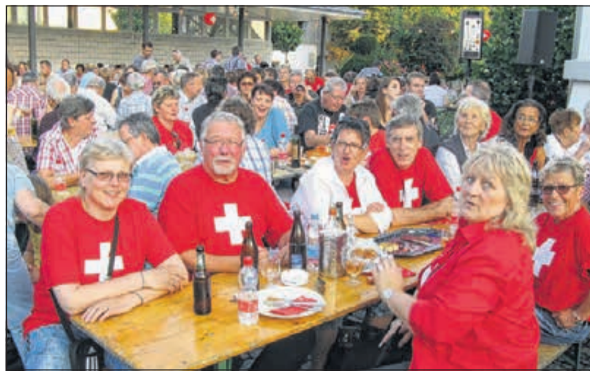
Erneut traf sich «tout Därwil» auf dem Areal des Bahnhof-Schulhauses, um gemeinsam den 1. August zu feiern.