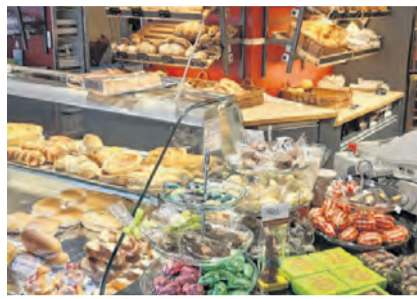
KMU Ettingen: Wir haben weiterhin offen Seite 10