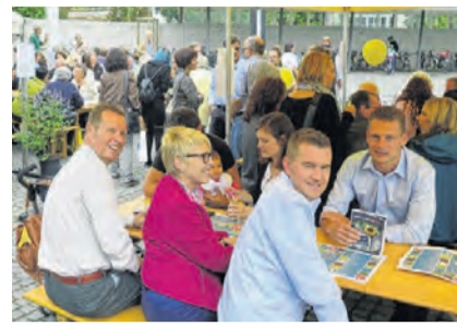
Therwil: Ein starkes Gewerbe