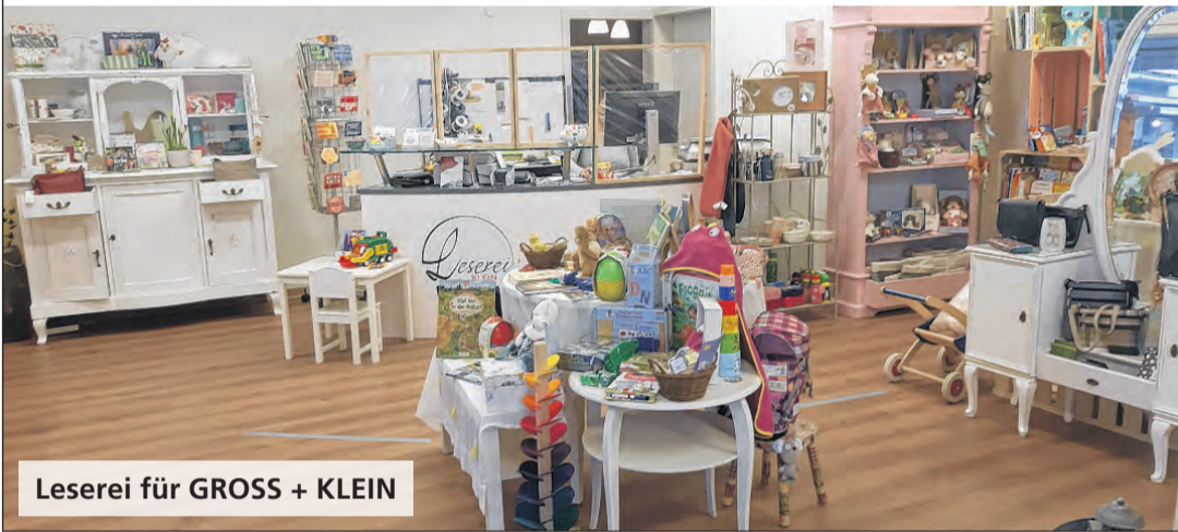
Leserei für GROSS + KLEIN