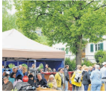
KMU Ettingen: Guggermärt-Frühlingserwachen, astop GmbH Seite 4