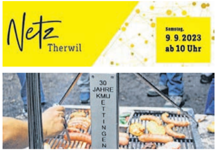
Netz Therwil, Grillplausch Ettingen Seite 2