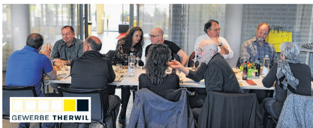
Die Generalversammlung 2023 des Vereins Gewerbe Therwil konnte wieder in Präsenz im APH «Blumenrain» veranstaltet werden.