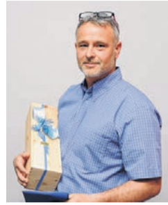
Gewerbe Therwil: Neuer Präsident gesucht, Frühlingsanlass Zolli Seite 6