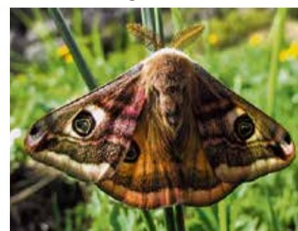
Kleines Nachtpfauenauge.

Da die Veranstaltung nur bei ansprechender Witterung stattfindet, haben wir als Verschiebedatum den 24. August vorgesehen. Im Zweifelsfall erteilt Tel. 061 721 69 95 ab 19 Uhr Auskunft über die Durchführung.