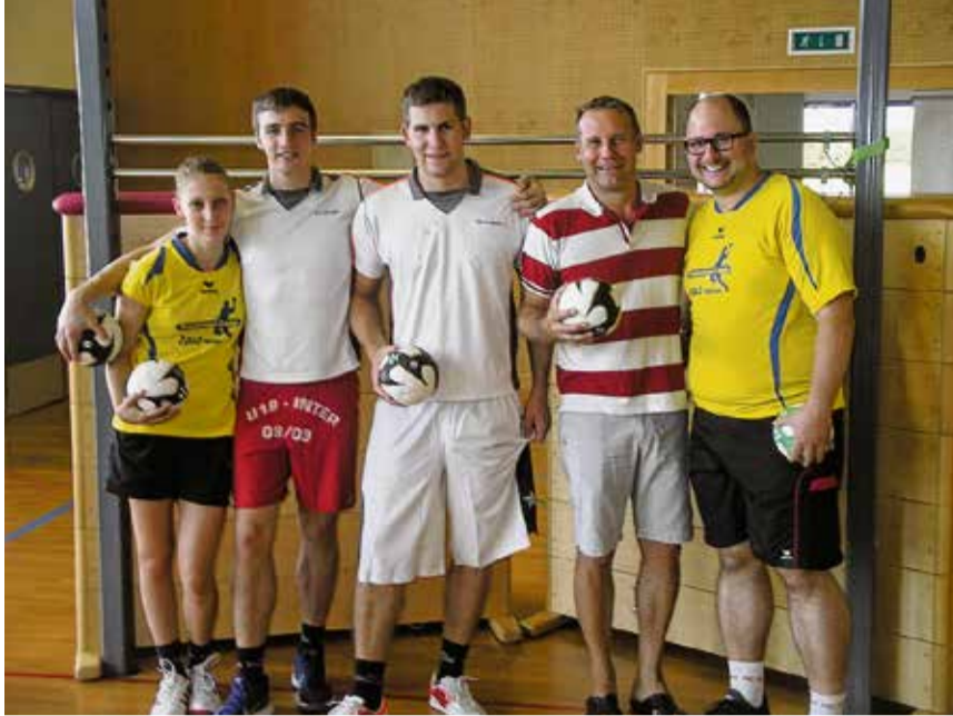
Was im 2011 (unsere Aufnahmen stammen aus dem Jahre 2012) begann, wird am übernächsten Sonntag zum 8. Male ausgetragen. Und Oberwil darf auf sein breites Sportangebot stolz sein!

Es gibt verschiedene Indikatoren, um die Lebensqualität einer Gemeinde zu definieren. Tatsache ist aber, dass das lokale Sportangebot – verbunden mit der nötigen Infrastruktur – eine bedeutende Rolle spielt. Um aktiv Sport machen zu können, braucht es, je nach Sportart, Hallen oder Plätze, deren Unterhalt oft kostspielig ist (wir denken da an Hallenbäder). Und es gibt Orte, die durch eine bestimmte Sportart national, sogar international bekannt geworden sind. In Nordamerika (USA, vor allem aber Kanada) ist Ambri (präziser: Quinto) allen Eishockey-Anhängern (und das sollen 95 Prozent der Bevölkerung sein) bekannt. Ein Weiler, der knapp 500 Einwohner hat ... aber über den Kultverein HC Ambri-Piotta verfügt. Wer Horgen denkt, sagt (auch) Wasserball. Und regional gesehen, haben Aesch (und Pfefingen) dank des Volleyballes, Birsfelden wegen des Basketballes (früher der