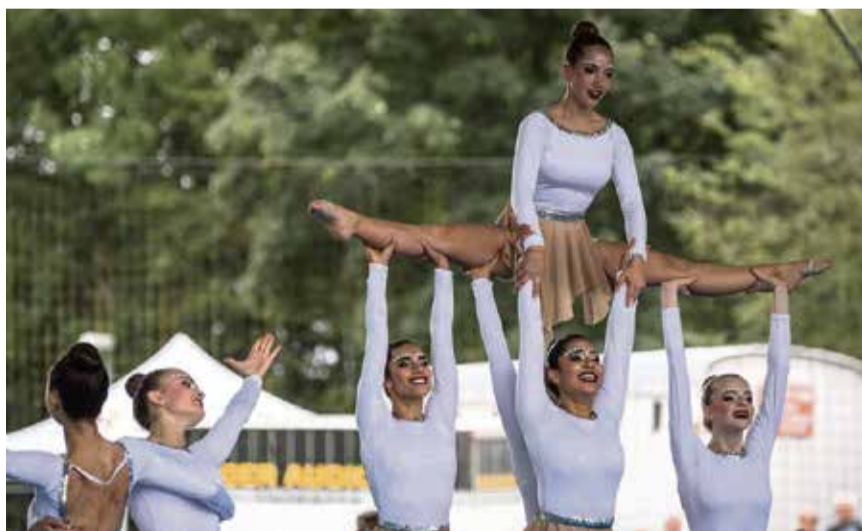
Les Papillons (oben und unten)