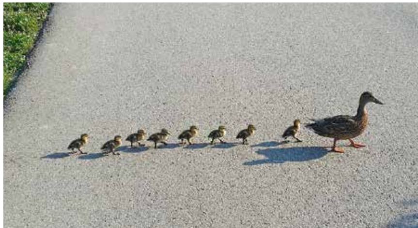
«Alle mir nach – wir gehen zum Marbach», so die Entenmutter zur Jungmannschaft, welche artig und brav der Mutter folgt.

Natur bezeichnet man in der Regel als das, was nicht vom Menschen geschaffen wurde. Der Begriff wird jedoch unterschiedlich und bisweilen in sich widersprechenden Bedeutungen verwendet, weshalb es oft strittig ist, was zur Natur gehört und was nicht. Und die Gattung Mensch unterliegt dem Irrtum, dass wir die Natur als eine Art «Selbstbedienungsladen» betrachten. Das ist sie nicht. Sie «rebelliert» nicht im politischen, aber im natürlichen Sinne. Wir haben kein Recht, hier den Moralapostel zu spielen. Wir alle wissen, dass wir den Abfall umweltgerechter entsorgen müssen. Uns ist bekannt, dass die grenzenlose Mobilität mit vielen Schadstoffen verbunden ist. Wir sollten wissen, dass Wasser unser kostbarstes Gut ist. Gemäss der letzten Studie von UNICEF und der Weltgesundheitsorganisation (WHO) haben weltweit drei von zehn Menschen – oder 2,1 Milliarden – zu Hause keinen Zugang zu sauberem Trinkwasser. Sechs von zehn Menschen – oder 4,4 Milliarden – mangelt es an angemessenen sanitären Einrichtungen. Tendenz steigend!