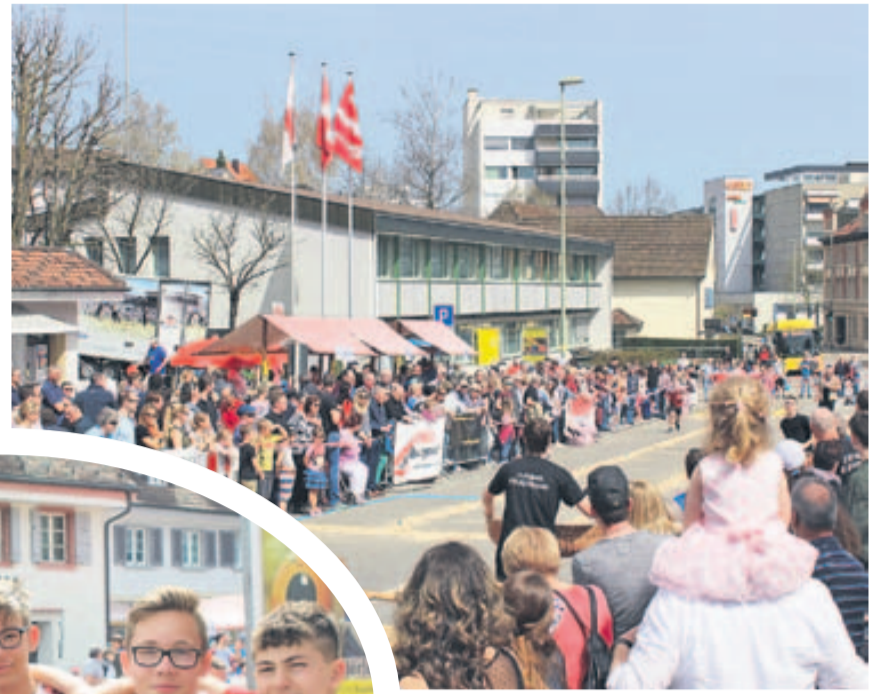
Wieder schönes Frühlingswetter am Eierläset.