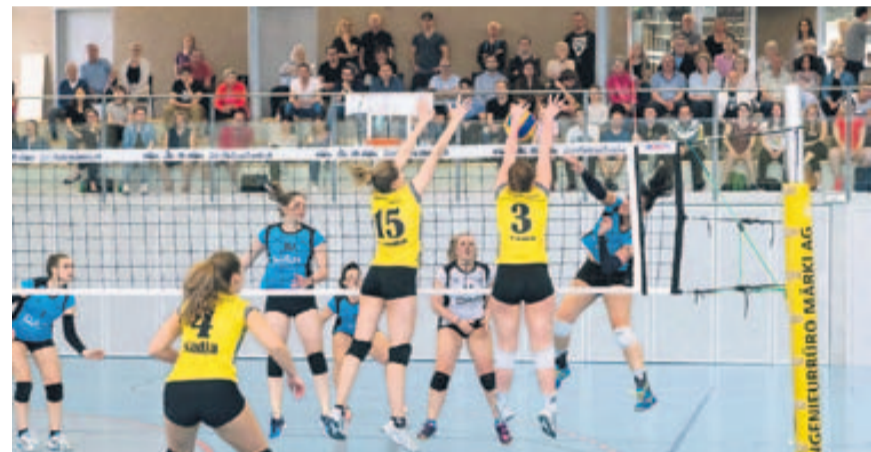
Therwil dominiert das Team aus dem Jura mit einem starken Kollektiv.