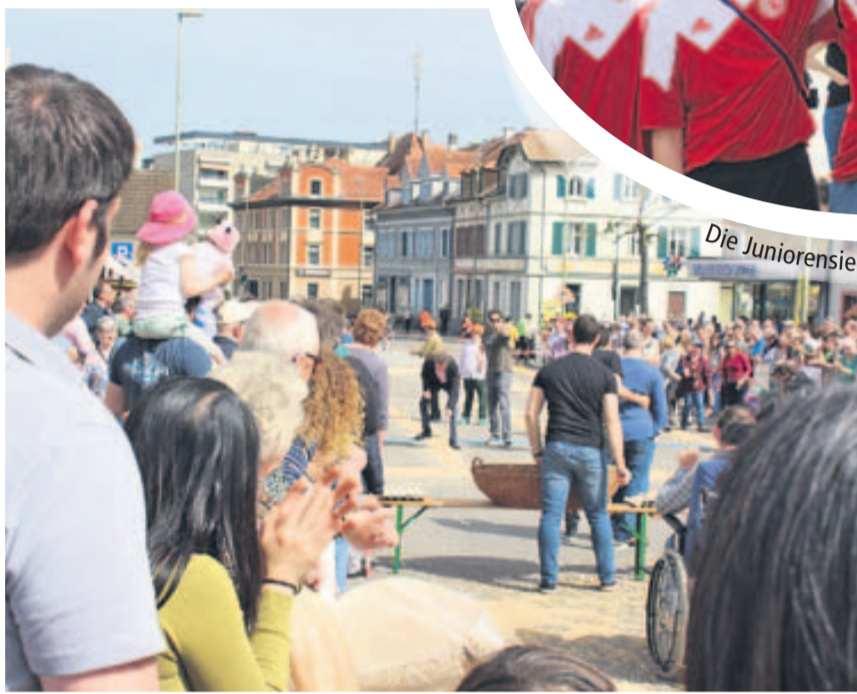
Die Juniorensieger des FC Oberwil.