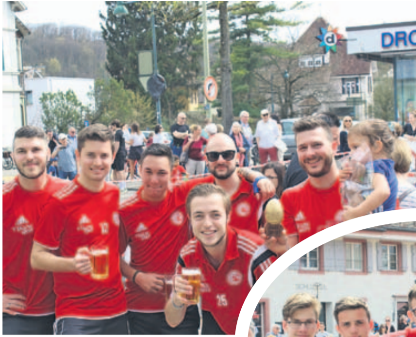
Kategorie Aktive: Die Sieger vom FC Oberwil.