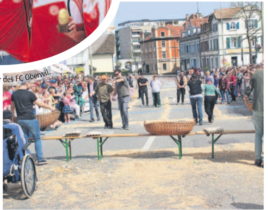
Menschen aus dem Wohnheim Im Rebgarten nahmen am Eierläset teil.