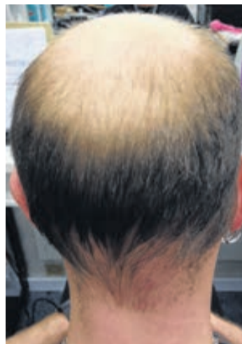
Nach ein paar Wochen. Behandlung ist noch nicht abgeschlossen.