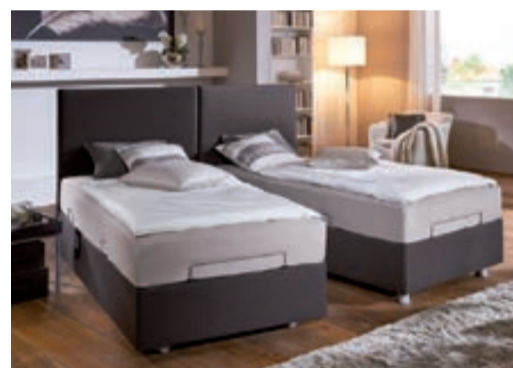
Modell Nevara: Bett verfahrbar zum leichten Reinigen und Bettenmachen.

rische Höhenverstellung um bis zu 38 cm in die Höhe und verhilft Ihnen zu mühelosem Aufstehen. Auch bei Arbeiten rund ums Bett unterstützt Sie die Höhenverstellung optimal. Ob Betten beziehen oder Wäsche zusammenlegen, in der