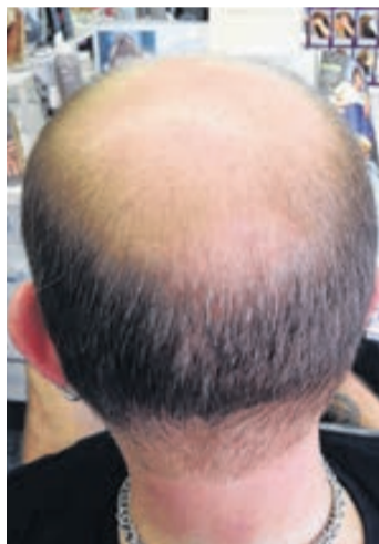
Beginn der Behandlung.