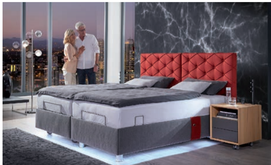
Modell Milano: In perfekter Handwerkskunst umgesetzt, besticht dieses Bett durch Eleganz und Ausdruck.

Höhenverstellbare Möbel am Arbeitsplatz oder elektrisch verstellbare Sitze im Auto sind längst selbstverständlich – gönnen Sie sich diesen Komfort auch in Ihrem Schlafzimmer! Mit der variablen Betthöhe geniessen Sie eine individuelle Ein- und Ausstiegshöhe auf dem für Sie richtigen Niveau. Mithilfe der leicht zu bedienenden und gut ablesbaren Funk-Fernbedienung oder dem Kabel-Handscharter lifft Sie die moto-