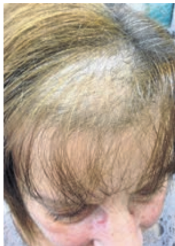
Beginn der Behandlung.