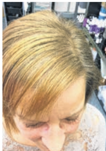
Nach ein paar Wochen. Behandlung noch nicht abgeschlossen.