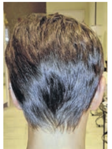
Kundin nach der Behandlung.