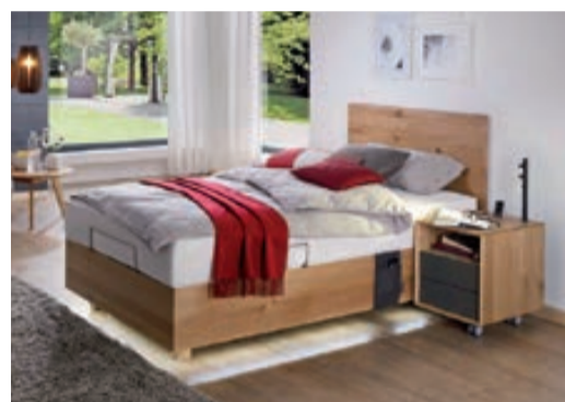
Modell Lugano: Massivholz Wildeiche, in diversen Grössen erhältlich.