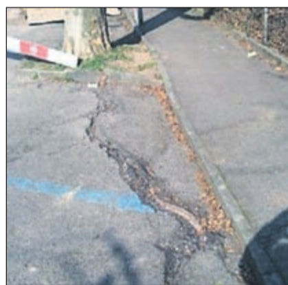
Platanenwurzeln durchbrechen den Asphalt.

Die grossen Platanen beim Sportplatz des Schulhauses Känelmatt 1 haben im Lauf der Jahre starke Wurzeln entwickelt, welche den umgebenden Strassen- und Bodenbelag an diversen Stellen aufgerissen haben. Trotz Rückschnitt der Bäume und Ausbesserung der Beläge haben die Schäden an Parkplatz und Trottoir immer mehr zugenommen. Die unebene Oberfläche ist teilweise zu einer Stolperfalle geworden. Die Wurzeln der Platanen haben auch die Tartan-Laufbahn auf dem Sportplatz aufgewölbt. Diese Schäden wurden bis heute bereits zweimal fachmännisch behoben, und die Tartanbahn wurde aufwendig saniert. Dennoch kann nicht verhindert werden, dass im Lauf der Zeit erneut Wurzeln die Laufbahn beschädigen. So wurde beschlossen, den Parkplatz umfassend zu sanieren. Dieser Entscheid wurde von der Gemeindeversammlung am 15. Dezember 2016 im Rahmen des Budgets 2018 genehmigt. Zu dieser Sanierung gehört auch, dass die «exotischen» Platanen gefällt und durch Säulenhagebuchen ersetzt werden. Diese säulenförmige Zuchtform der einheimischen