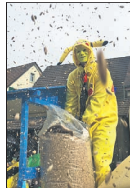
Die farnefrohen Sonntagsumzüge in Oberwil, Therwil und Ettingen (von links nach rechts) lockten Tausende von Schaulustigen von nah und fern ins «BiBo-Land».

Es mag Leute geben, welche vor der Fasnacht förmlich flüchten. Da Frau Fasnacht, sowohl auf dem Land wie in der Stadt, in die Sportferien fällt, nehmen wir an, dass diese Zeitgenossen einer winterlichen (Schnee-)Aktivität respektive Sportart den Vorzug geben. Es gibt aber ebenso viele Menschen, welche vom Fasnachtsvirus förmlich ein Leben lang infiziert sind und Fasnacht nicht machen, sondern (vor-)leben.