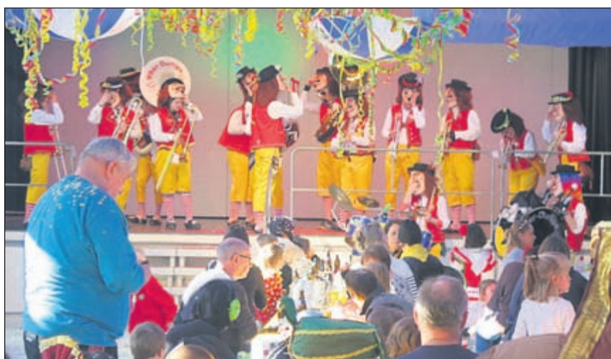
Die Samba Schnoogge eröffneten das Guggenkonzert auf dem Dorfplatz – am Nachmittag hatten die Durlips in der Mehrzweckhalle anlässlich des Kindermaskenballes aufgespielt.