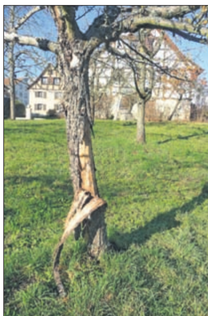
Ein vom Pilz befallener Apfelbaum vor dem Kuenze Huus.

Um die gesunden Bäume zu schützen, werden einige besonders stark geschädigte Bäume in absehbarer Zeit entfernt. Bei dieser Gelegenheit sollen, in Absprache mit dem Pächter, die zu rodenden Bäume durch Bäume krankheitsresistenter, möglichst alter Sorten ersetzt werden. Die Jungbäume werden mit einem Wurzelschutz gegen Mäuse gesichert, sodass sie geschützt heranwachsen können. Weitere Infos folgen zu gegebener Zeit.