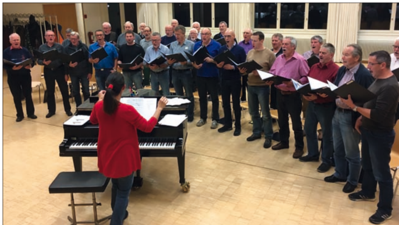
Ab Mittwoch, dem 16. August, finden wieder Proben statt.