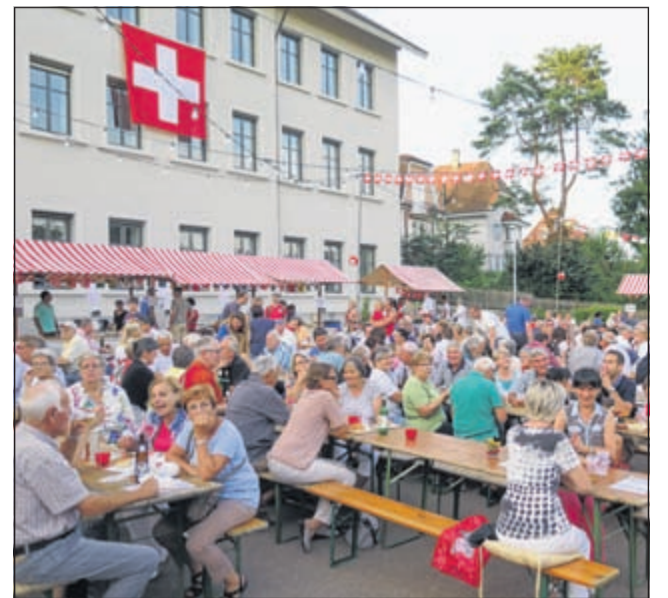
Im Jahr 2015 musste die Feier in die Wehrlinhalle verlegt werden, im letzten Jahr feierte man auf dem Platz draussen.

Am nächsten Dienstag begeht die Schweiz ihren Nationalfeiertag. Eine Chronik zum 1. August finden Sie in dieser Ausgabe auf der Front – geschrieben von Rudolf Mohler, dem ehemaligen, langjährigen Gemeindepräsidenten von Oberwil.