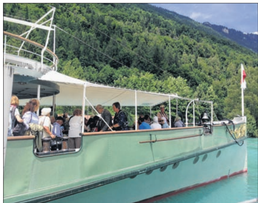
Seniorenferien – Auf dem Brienzersee

9.30 Eucharistiefeier in der Alten Dorfkirche Allschwil