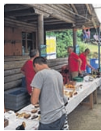
KMU Ettingen sponsert neuen Grillrost Gewerbe Therwil: Neuer Vorstand