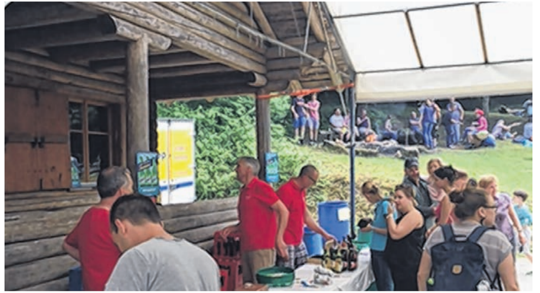
Dorffest bei der Blockhütte.

Und damit das Ganze auch richtig feierlich daherkommt, wird es kommenden Herbst auch eine passende Einweihung geben. Dann nämlich werden die Würste, die am vergangenen Vereinsausflug in die Metz gerei Jenzer entstanden sind, auf dem neuen Rost gebrätelt. Details und Impressionen dazu in der nächsten Ausgabe. (car)