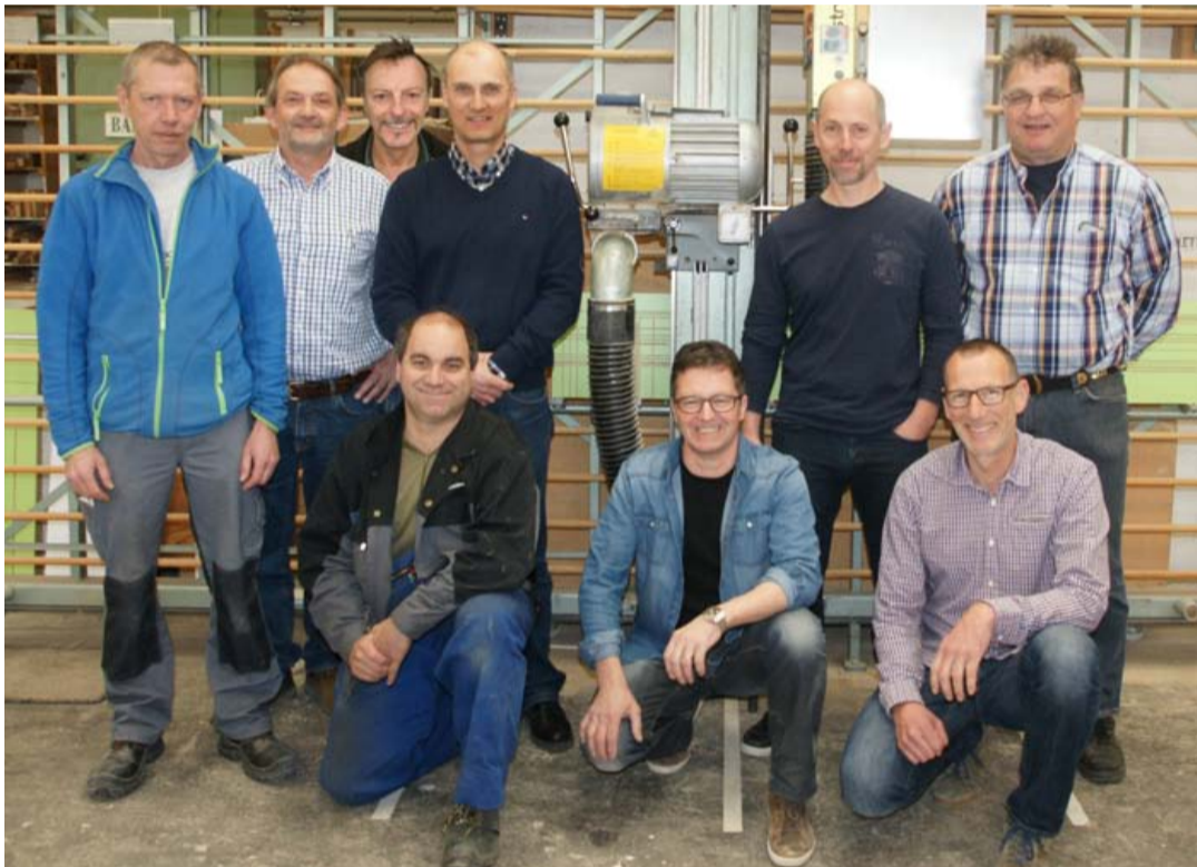
Organisationsteam Baugruppe KMU Ettingen