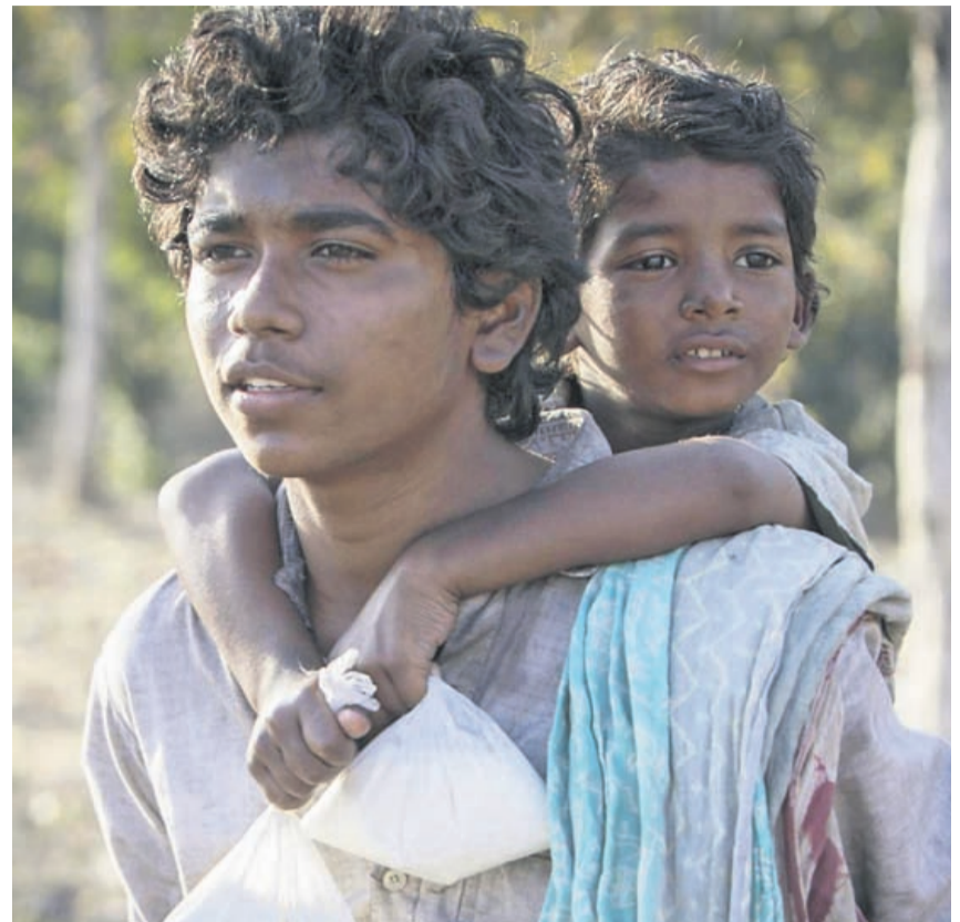
«Lion – Der lange Weg nach Hause»