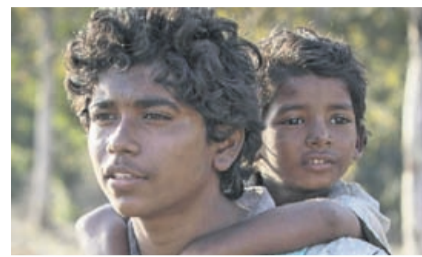
9. Open-Air-Kino in Ettingen «Lion – Der lange Weg nach Hause» und «Unterwegs mit Jacqueline / La Vache».