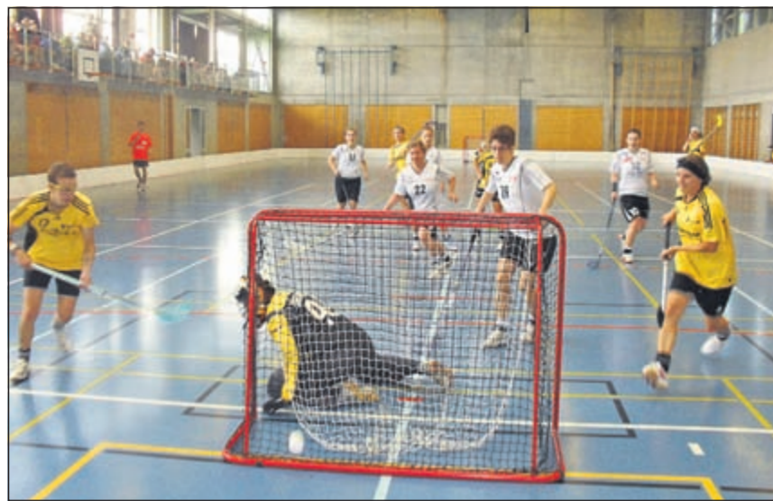
Unihockey ist eine dynamische, rassige Sportart, welche im (Hinteren) Leimental sehr beliebt ist.

Nachdem Oberwil eine Woche zuvor im Rahmen vom Leimental Challenge die Wettspiele der Nachwuchsteams genießen durfte, traten am letzten Wochenende in Ettingen am Samstag die Herren, am Sonntag die Damen auf. Noch ist dieser Sport nicht so bekannt, dass er grössere Massen an Zuschauern anziehen kann, obwohl das muntere Spiel solches durchaus verdienen würde. Mit Blick auf die Popularität muss man aber sehen, dass in der Schweiz Unihockey hinter dem kaum einholbaren Fussball und dem Volleyball der Mannschaftssport mit den drittmeisten Aktiven ist, noch vor dem Handball und dem Eishockey. Zurzeit sind rund 30000 Spieler und Spielerinnen lizenziert. Die Turniere im Leimental wurden auf dem Grossfeld gespielt, das in den Ausmassen dem Feld des Handballs entspricht. Wie beim Eishockey wird auch hinter den Toren gespielt und umgeben ist das Spielfeld von einer Bande. Wir sprechen hier keineswegs respektlos von Zuschauern, sondern von einer Umrandung,