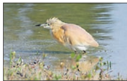
Rallenreiher am Fanel.

Das Fanel ist ein Feuchtgebiet von internationaler Bedeutung und liegt am Südostende des Neuenburgersees. Für Wasservogel ist das Fanel eines der wichtigsten Brut- und Überwinterungsgebiete der Schweiz. Zudem liegt es innerhalb des grössten Schilfgebietes der Schweiz, der Grande Cariçaie. Bisher wurden hier über 300 Vogelarten nachgewiesen, auch viele Raritäten (siehe Foto). Das Fanel ist zu allen Jahreszeiten für Ornithologen attraktiv; das zeigt uns der Referent mit eindrucksvollen Bildern.