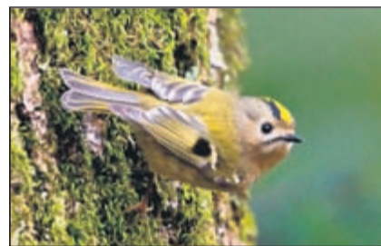
Wintergoldhähnchen.